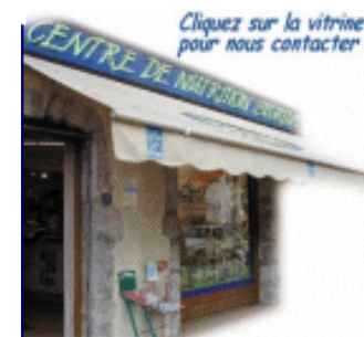
Cliquez sur la vitrine pour nous contacter !

Téléphone +33 (0) 4 79 85 89 27 Adresse T EN FORME 75-77 rue Ste-Rose BP 17 22 73 017 Chambéry cedex